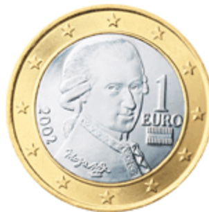
Euro - Münze