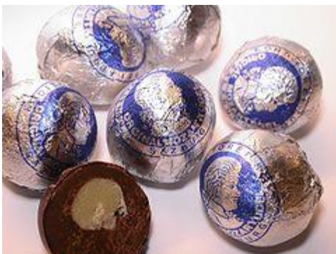
Mozart - Kugeln