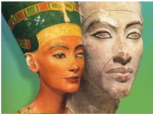
Mein Vater und seine Frau Nofretete